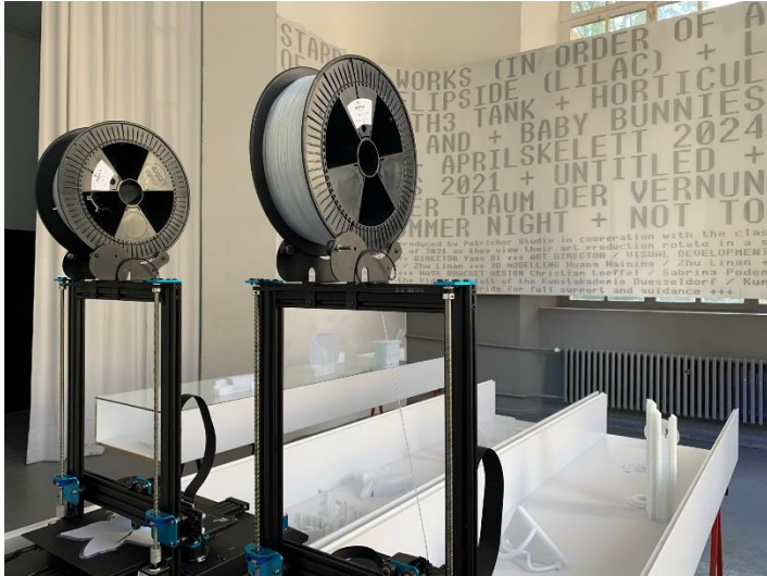
Klasse McBride, Lanquished Installationsansicht Kunstakademie Düsseldorf, 2021