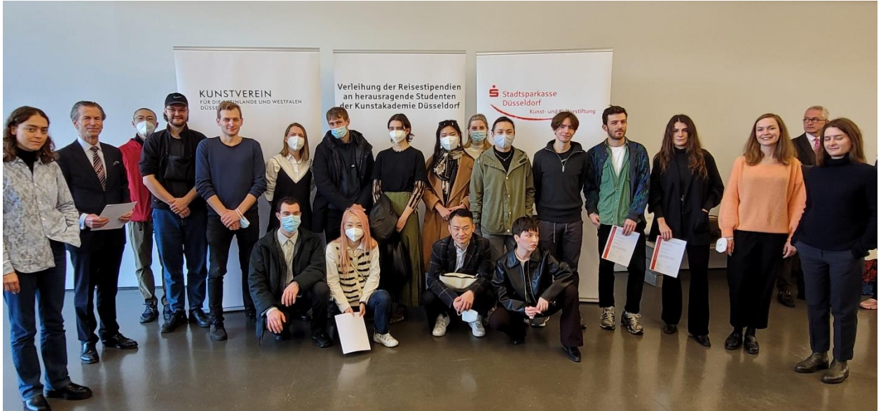
Vergabe der Stipendien im Kunstverein für die Rheinlande und Westfalen am 29. Oktober 2021