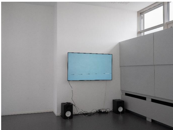
Klasse Josephine Pryde, Bulletin Board , Installationsansicht Kunstakademie Düsseldorf, 2026, Foto: Justus Lietzke und Lea Babel

Die Klasse für Fotografie , die im Oktober 2025 von der britischen Künstlerin Josephine Pryde übernommen wurde, präsentierte auf dem diesjährigen Winterrundgang eine gemeinsame Arbeit: Bulletin Board und Bulletin Board II .