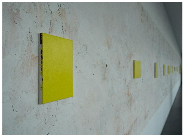
Klasse Josephine Pryde, Bulletin Board II (Detail), Installationsansicht Kunstakademie Düsseldorf, 2026, Foto: Justus Lietzke und Lea Babel

Ausgehend von einer räumlichen Setzung fand sich der neu gebildete Klassenverband im Gespräch zusammen, in dessen Zentrum die Frage stand, welche Formate und Sprachen zur Verfügung stehen, um über die eigene Arbeit ebenso wie über die Arbeiten anderer zu sprechen. Die meterlange Pinnwand, die vom ehemaligen Professor Christopher Williams eingerichtet worden