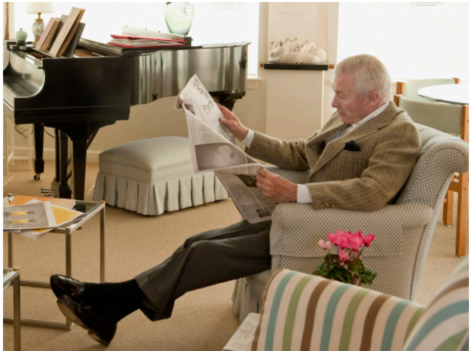
Ein möglichst langes, selbstbestimmtes Leben in den eigenen vier Wänden, das ist der Wunsch der meisten Senioren und wird mit dem Projekt CuxViTA unterstützt.

Stiftungsbetreuerin Gründungen, Fundraising, Stiftungsmarketing, Projektmanagement Kompetenz-Center Stiftungen der Stadtsparkasse Düsseldorf